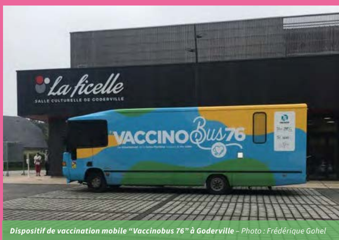
Dispositif de vaccination mobile "Vaccinobus 76" à Goderville