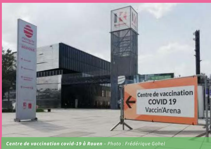
Centre de vaccination covid-19 à Rouen

Les personnes étrangères résidant en France et sans droit à l'Assurance Maladie pourront également accéder à la vaccination. Elles seront retracées dans le système d'information vaccin via un identifiant d'urgence.